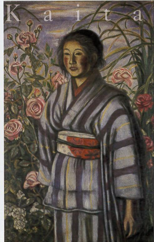
村山槐多《バラと少女》1917年 東京国立近代美術館