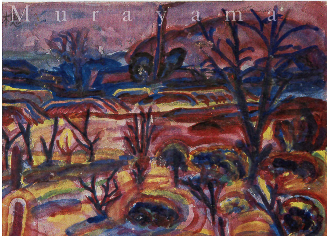
村山槐多《田端風景》1914年 個人蔵